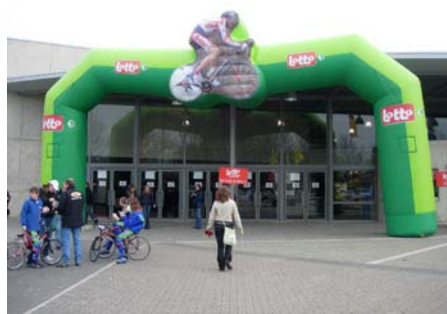
写真 2. 会場入り口