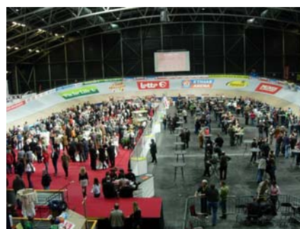
写真 3 & 4. バンク内部