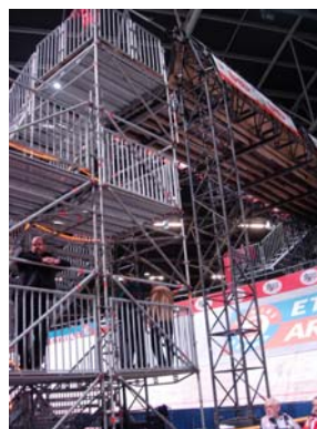
写真 5 & 6. トラックを跨ぐブリッジ