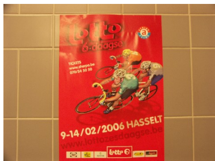
写真 1. 大会ポスター

オランダと国境を接するリンブルグ州の州都ハッセルトのエシアス・アリーナ (Ethias-arena) において、2006 年 2 月 9 日 (木) ~14 日 (月) の日程で 6 日間レースが開催された。6 日間レースがハッセルトで開催されるのは初めてであった。大会スポンサーのロト (ベルギー公認のスポーツくじ等を扱う組織) が、サポートしているロトチーム所属選手を紹介するイベントなどがあり多数の観客を集めていた。