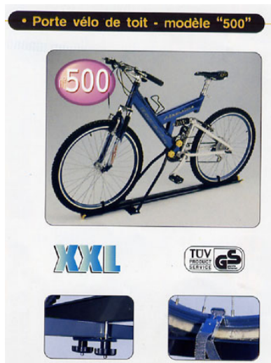
① 自転車用ルーフラック