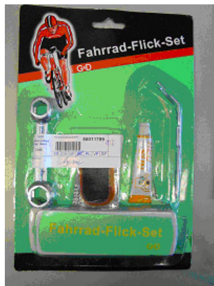
⑨パンク修理キット