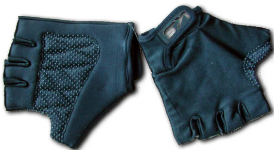
③ サイクリング用手袋