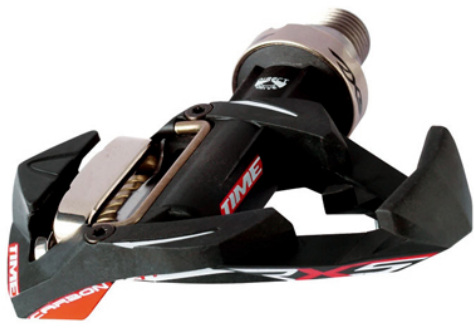
⑦ビンディングペダル