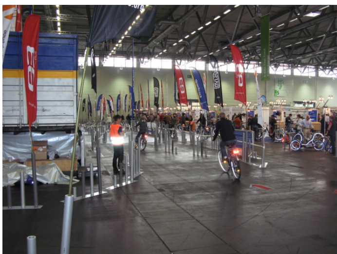
電動自転車試乗コース(ホール 6)