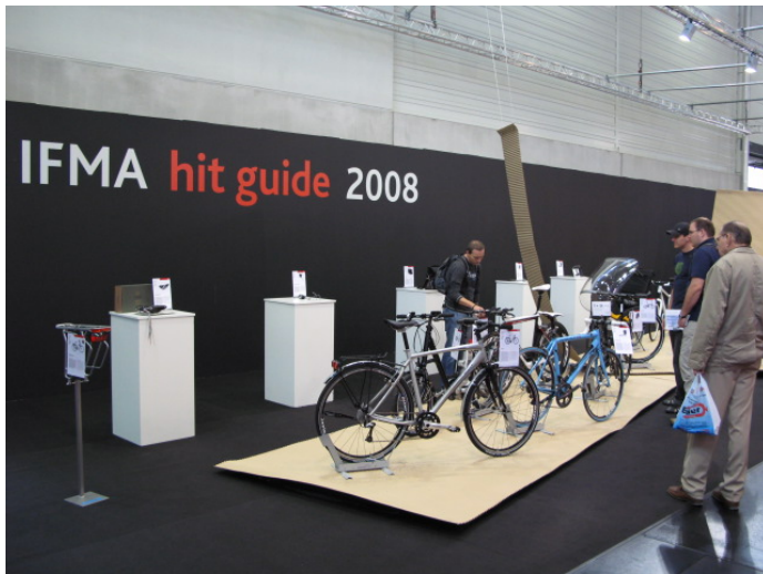
「IFMA hit guide 2008」コーナー

なお、IFMA は来年 2009 年の開催は取り止めとなった。長らく欧州を代表して開催されてきた同展は今年 2008 年をもってその役割を終えた。主催者のケルンメッセは、翌々年 2010 年 10 月 13 日～17 日の 4 日間、オートバイ展示会 INTERMOT に「自転車」を統合し、新たに二輪車展として開催する予定である。