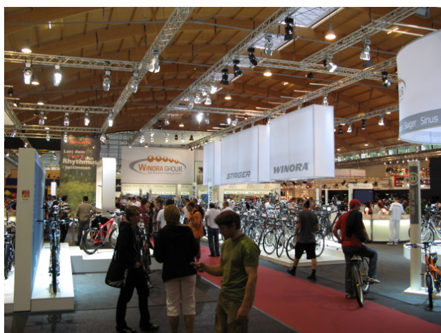
新設 B5 ホールの様子

なお、来年の開催は、2010 年 8 月 25 日(水)～28 日(土)の 4 日間の予定である。