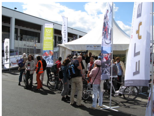
屋外の電動自転車試乗コーナー