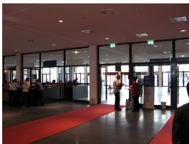
今年から完成した東入口