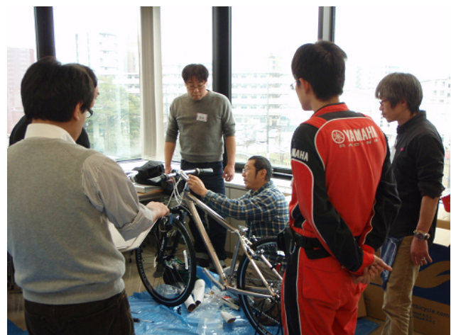
スポーツバイクの組立(MTB・クロスバイク教室)