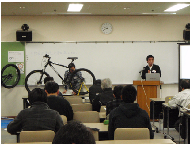
MTB 講座・サスペンション編

午後からは基礎講座恒例となった「ロードレーサー」「MTB・クロスバイク」の2コースから選ぶスポーツバイクの組立実技へと移行。今回はメンテナンス技術の幅を広げるために、あえて自分の店で専門的に取り扱っている商材以外の組立実技コースを選択する熱心な受講生もみられた。