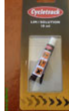
48. パンク修理用接着剤