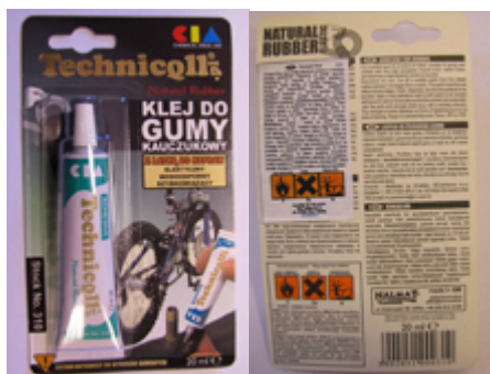
9. パンク修理キット