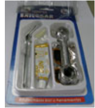
56. パンク修理キット