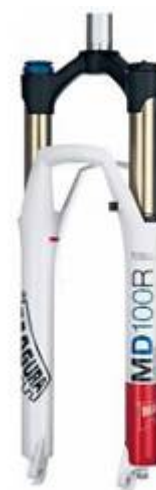
11. サスペンション前フォーク