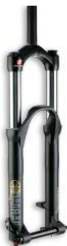
10. サスペンション前フォーク