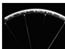
12. フロントホイール