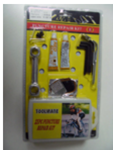
5. パンク修理キット