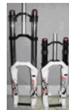
27. サスペンション前フォーク