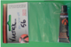
20. パンク修理用接着剤