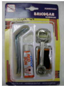
33. パンク修理キット