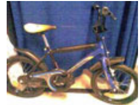
幼児車（左から順に 36、37、38、39）