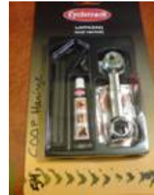
パンク修理キット (左から順に 21、22、23、24)