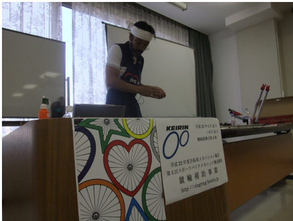
上級講座【レーシング現場のホイール組】

平成22年6月22日(火)～24日(木)の3日間、機械振興会館(東京都港区)で第5回スポーツバイクメカニック養成講座が開催され、全国各地より応募のあった意欲溢れる29人が受講した。また初日に実施した上級講座には、受講生29人の他に、14人の修了検定合格者が聴講した。最終日(24日)には筆記と実技からなる修了検定を実施し、養成講座受講生と修了検定試験受験資格者の33人(申込者34人、欠席1人)が試験に挑み、うち12人が合格した。合格基準は筆記、実技ともに70点以上となっており、今回の合格率は約36%となっている。 ※昨年合格率 約31%(受験者数29人、内合格者数9人)