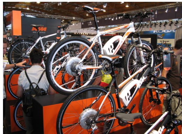
今年も電動アシスト自転車が目立った (左 : ジャイアント、右 : KTM)